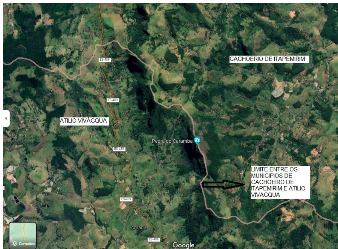
FIGURA 1: A pedra fica no limite dos municípios de Cachoeiro de Itapemirim e Atílio Vivacqua.

Av. Américo Buaiz, 205, Gab. 701, Enseada do Suá – Vitória – ES – CEP 29.050-950 Tel: 27 3382-3543 / 27 3382-3699 – e-mail: doutoremiliomameri@al.es.gov.br