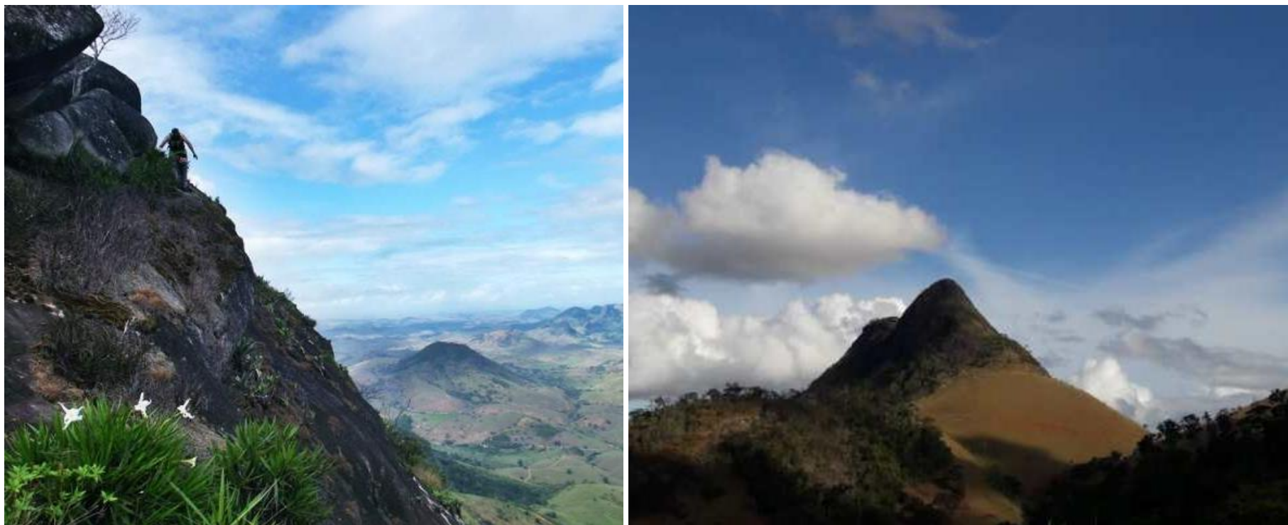
FIGURA 3 E 4: Imagens do local.

Av. Américo Buaiz, 205, Gab. 701, Enseada do Suá – Vitória – ES – CEP 29.050-950 Tel: 27 3382-3543 / 27 3382-3699 – e-mail: doutoremiliomameri@al.es.gov.br